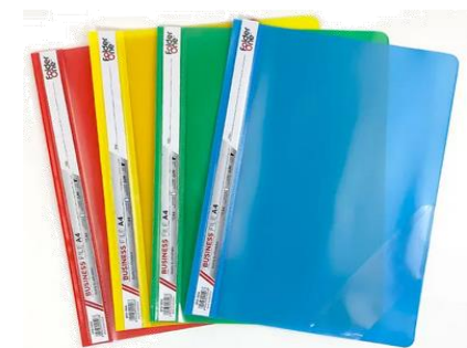
Contoh map snail hecter

Ketentuan warna map: Jalur penerimaan Zonasi (merah) , Afirmasi (biru) , Pindah Tugas Ortu. (hijau) , dan prestasi (kuning) .